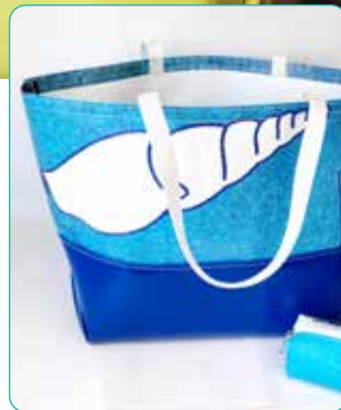
CABAS DES HALLES