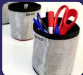
POT À CRAYON