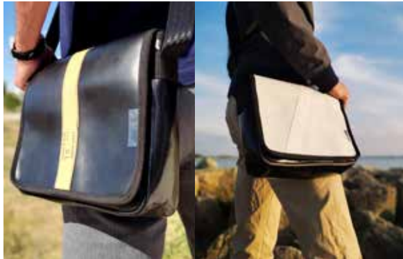
PETITE SACOCHE ENCAN